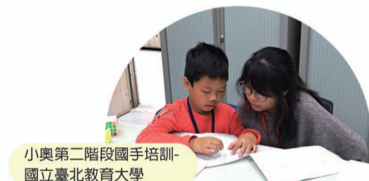
小奧第二階段國手培訓-國立臺北教育大學