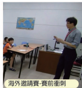
海外邀請賽-賽前衝刺