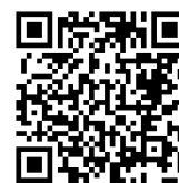
桃園市公立及非營利幼兒園 招生網